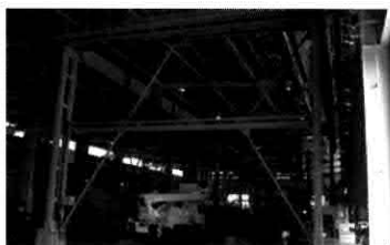
製造事例 / 産業機器架台

鉄鋼加工は、材料の調達から始まり、製造・輸送にいたるまで全てをお任せいただける一貫加工体制が可能です。それを支えるのは、総延長420mのレーザー切断ラインや、18mの長尺物を高精度で加工できる3000トンプレスを含む加工設備、そして熟練の技術を持ったスタッフとCAD/CAM/IT化された生産管理システムなどです。コストダウンや納期短縮など、お客様の鉄鋼加工に関わる全てのご要望にお応えいたします。