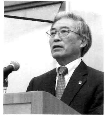
▲挨拶をする国東会長