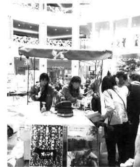
▲「オリーブ牛」試食コーナー